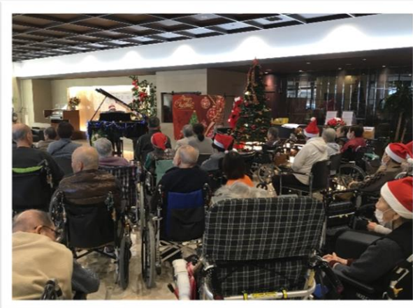
クリスマスコンサート もちつき大会