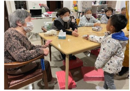
クリスマス園児訪問