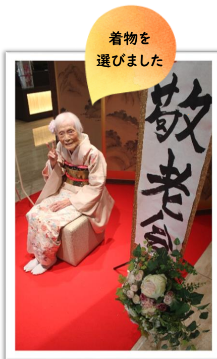
着物を選びました