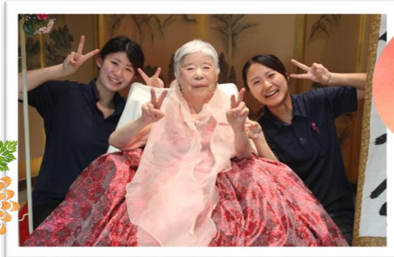
職員もいっしょに楽しみました

ご希望の方は、サニープレイス彦根が誇る豪華衣装に身を包んで、敬老会にご出席いただきました。