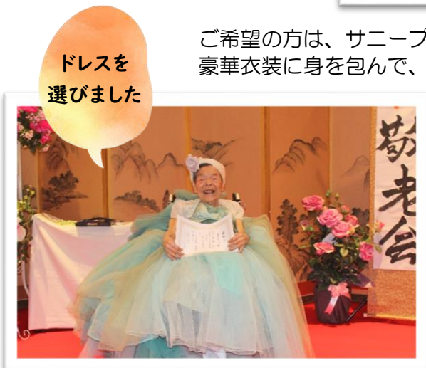
ドレスを選びました