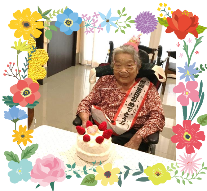
ショートステイ滞在中の利用者様 お誕生日の近い利用者様の 誕生日のお祝いをしました。