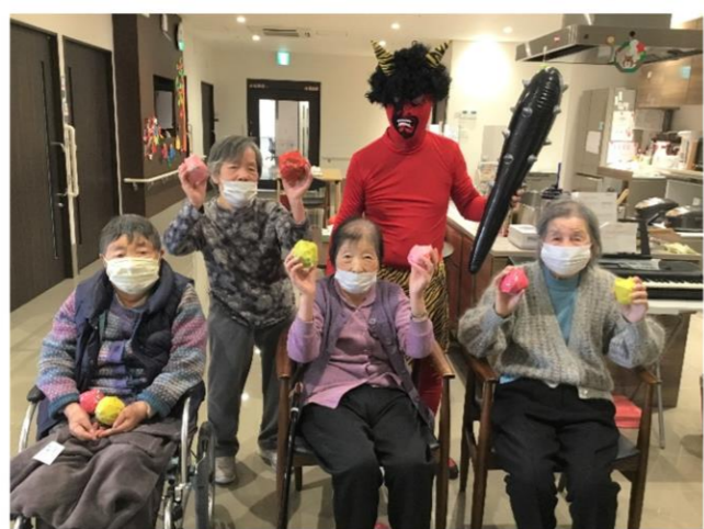
豆まきの後は赤鬼と仲良く記念撮影です📷

今年も節分の時期がきました。サニープレイス彦根にも、毎年恒例の鬼が参上！！年を増すごとにどんどんリアルな赤鬼になっています(笑)サニープレイス彦根の4階から姿を現した赤鬼。律儀にも3階から2階へと順番に退治されにきてくれます。どの階でも本物の豆ではなく豆に見立てた新聞紙を丸めたボールで鬼退治をします！「鬼は外！福は内！！」と大きな声が建物中に響き渡ります。普段物静かな方でも、節分は大きな声で豆まきをしてください。普段とは違った一面を発見できます☆