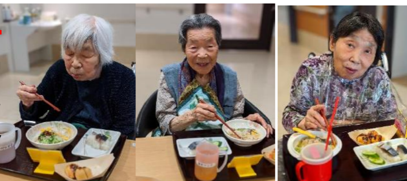
夏祭りスペシャルメニューを食べておられる様子

今年のサニープレイス彦根夏祭りは、新型コロナウイルス感染症拡大予防のため中止となりました。大人数が参加する夏祭りは実施することはできませんでしたが、しかし、各ユニットでは夏祭りを行いました！！