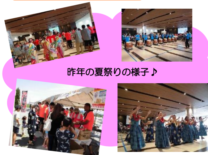
昨年の夏祭りの様子♪