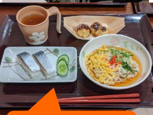
鯖寿司やたこ焼きなど夏祭りスペシャルメニュー！！