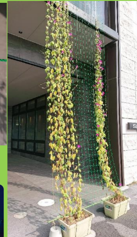
夜は青色にライトアップ