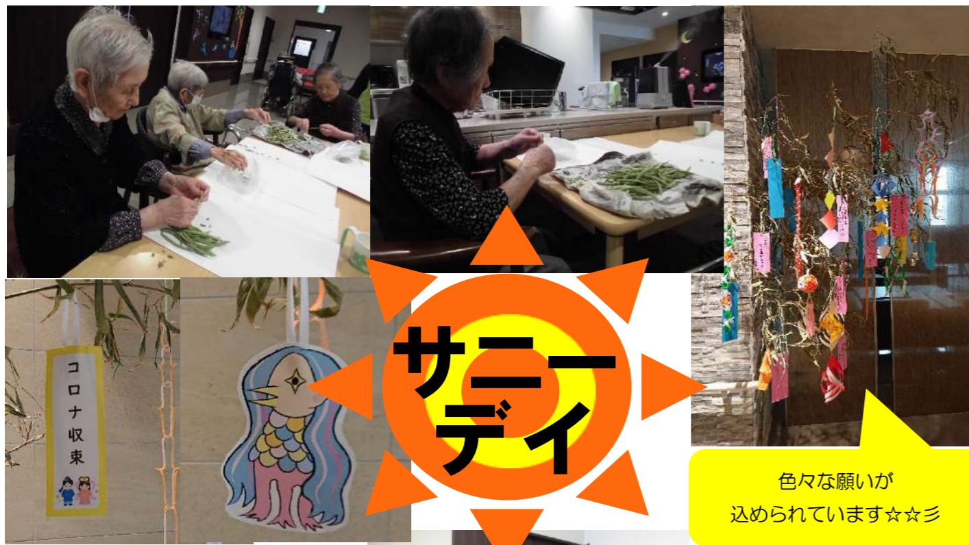
色々な願いが 込められています☆☆☆