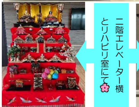
二階エレベーター横 トリハピリ室にて