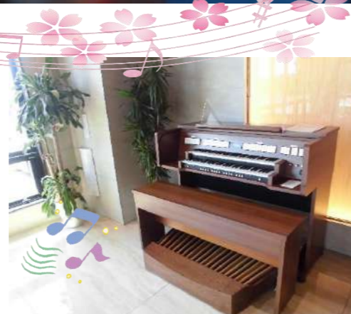
1階エントランスホールに設置しています♪

教会よりクラシックオルガンを寄付していただきました。クラシックオルガンはクラシック音楽のパイプ・オルガン曲を中心に演奏するための楽器(オルガン)を指します。 クラシックオルガンを演奏してくださる方を大募集しています☆